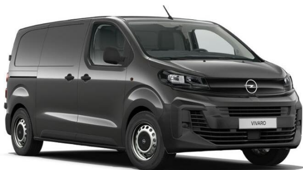
Šedá Merkur (1JM0) 600 €