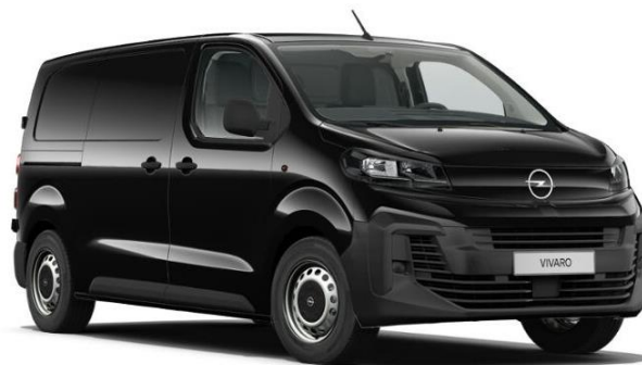
Čierna Karbon (9VM0) 600 €