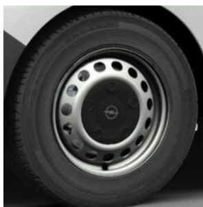
16" ocelové disky