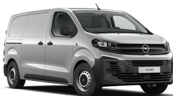
Šedá Kontrast (F4M0) 600 €