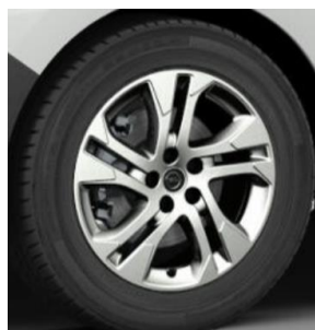
17" disky z ľahkej zliatiny (ZHSL) 740 €