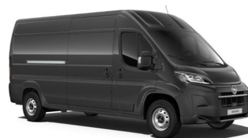
Šedočierna Graphite (E9M0) 1 000 €