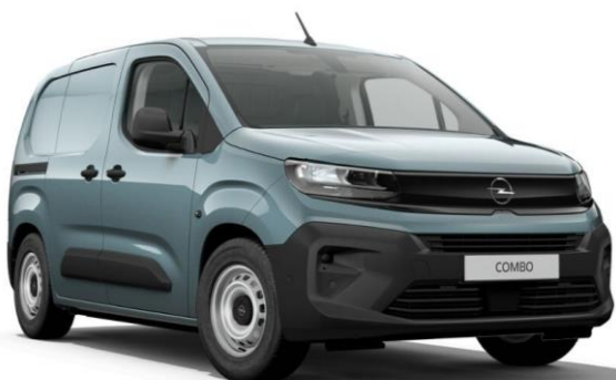
Modrá Kiama (M6M0) 450 €