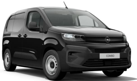
Čierna Karbon (9VM0) 460 €