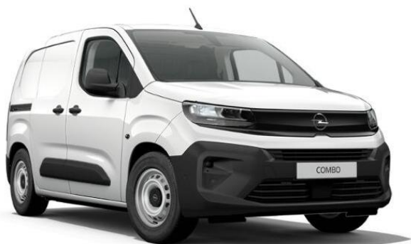
Biela Kaolin (PRPO) 0 €