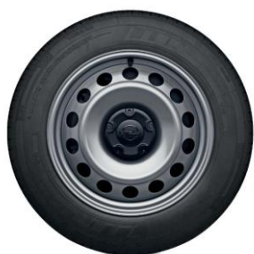
16" oceľové disky