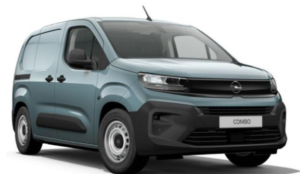
Modrá Kiama (M6M0) 450 €