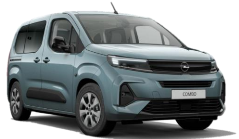
Modrá Kiama (M6M0) 500 €