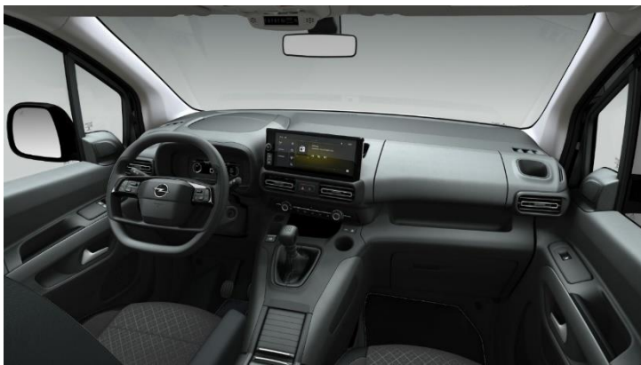
Interiér šedý Mistral Gray CMFY / CQFY Edition / Edition Plus – 0 €