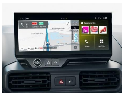
Multimediálny systém NAVI IVI 10" displej, Wifi Mirroring, 2x USB C, Opel Connect