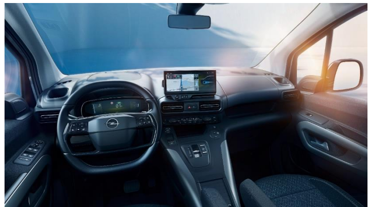
Interiér šedý Mistral Gray Uplevel s šedými metalickými prvkami CQFY GS – 0 €