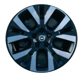
17" x 7,0 disky z ľahkej zliatiny (DZG7)