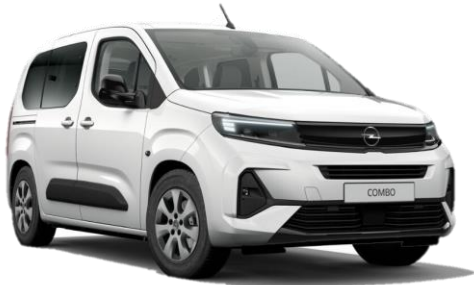
Biela Kaolin (PRPO) 0 €