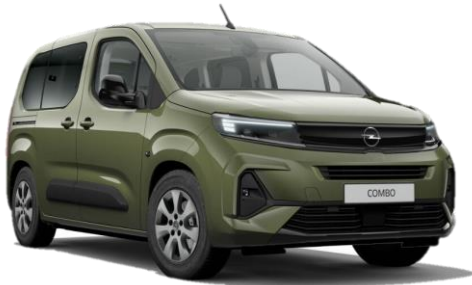
Zelená Sirkka (4QM0) 500 €