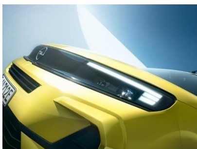
IntelliLux LED PIXEL adaptívne svetlomety