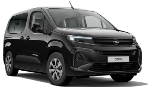
Čierna Karbon (9VM0) 500 €